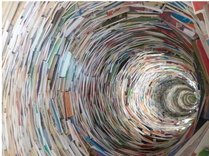
„Studnia wiedzy”

Szkoła nie tylko może pochwalić się bogatymi zbiorami Rodziny Grabskich – drzewem genealogicznym, archiwalnymi zdjęciami, książkami, meblami i pracami Pań Anny i Stanisławy Grabskich, ale także uratowaną werandą z przedwojennego Sulejówka w stylu świdermajer, oraz imponującą „studnią wiedzy” zbudowaną współcześnie z różnych książek, zebranych w Szkole.