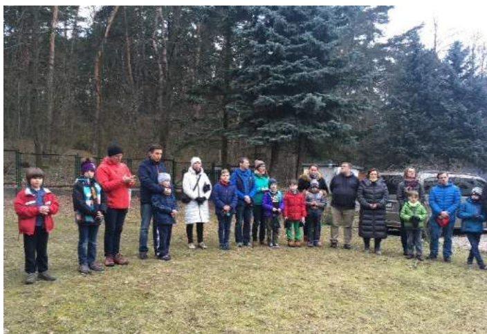
Otwarcie grupy SR Melianie.

Kolejne wyjazdy inicjujące powstanie grupy nr 88 i 89 były zaplanowane w pod koniec marca. Z powodu sytuacji epidemiologicznej wyjazdy zostały przesunięte wstępnie na koniec maja, ale ostateczne daty oczywiście uzależnione są od tego, kiedy zostaną zniesione ograniczenia związane z epidemią.