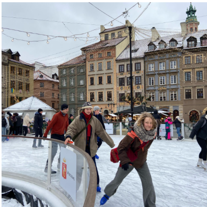
Zimowe łyżwy na Starówce